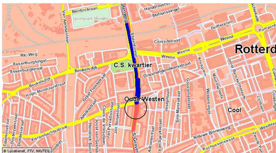
Lokatie Henegouwerweg Rotterdam